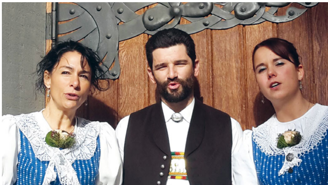
Das Toggenburger Jodelerzett wird den Gottesdienst am Reformationssonntag, 5. November, im Kirchgemeindehaus in Oberriet musikalisch begleiten.

Samstag, 11. November, 14 bis 16 Uhr beide Termine im Kirchgemeindehaus in Oberriet