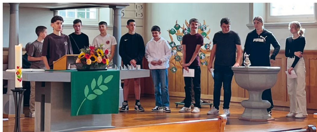
Vorstellung der Konfirmandinnen und Konfirmanden am 24. September 2023

Wir danken Ihnen herzlich für Ihren finanziellen Beitrag. Die Kirchenvorsteherschaft