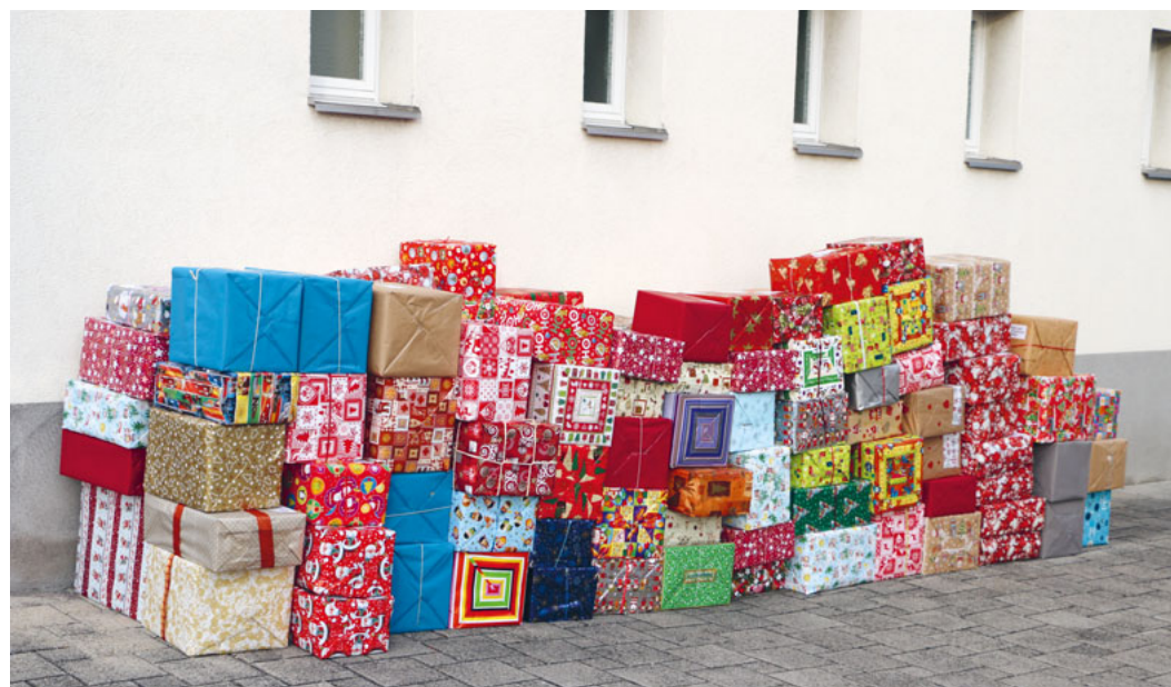
Jedes Jahr werden in unserer Kirchgemeinde eine beachtliche Anzahl Weihnachtspäckli gesammelt (im letzten Jahr waren es 140 Stück) und an Not leidende Familien in Osteuropa verschickt.